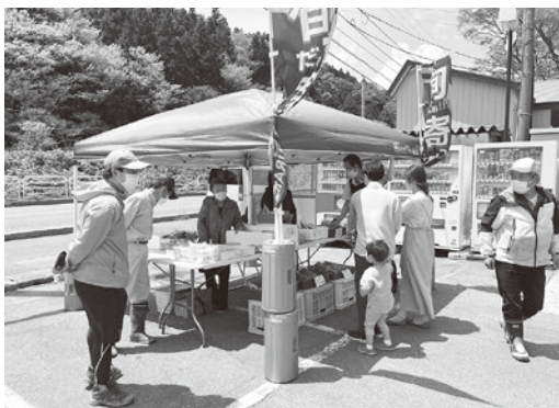
↑ GW 白糸の滝ドライブイン