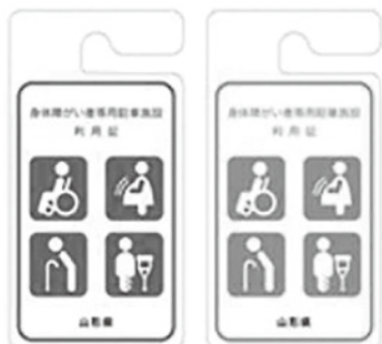
山形県身体障がい者等用駐車施設利用証

しかし最近、利用証を掲示していない車が優先駐車場を利用している、との声が寄せられています。優先駐車場を本当に必要とする方が利用できるように、皆様のご理解とご協力をお願いいたします。