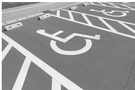
身体障がい者等用駐車場