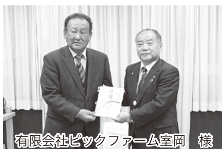
有限会社ピックファーム室岡 様

この度、南陽市(有)ピックファーム室岡様、新庄市(株)新庄砕石工業所様の2社より、地方創生応援制度（企業版ふるさと納税）を利用した寄附金をいただきました。多大なる寄附を賜り厚く御礼申し上げます。