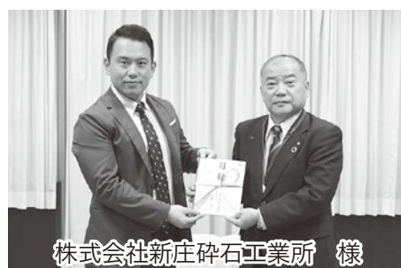
株式会社新庄砕石工業所 様