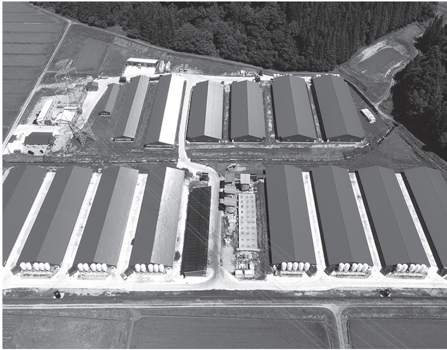
戸沢ファーム施設全体写真