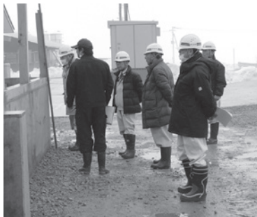
戸沢ファーム現地確認