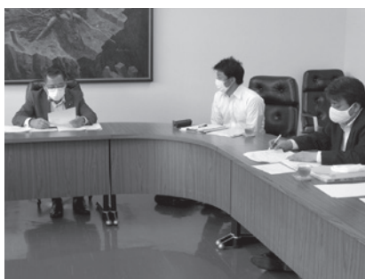
戸沢ファームとの協議

村長 環境保全協定書に基づき、年2回（7月、10月）を基準に戸沢ファームにて実施しており、調査結果を村に報告いただいております。