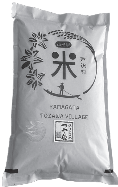
ふるさと納税返礼品