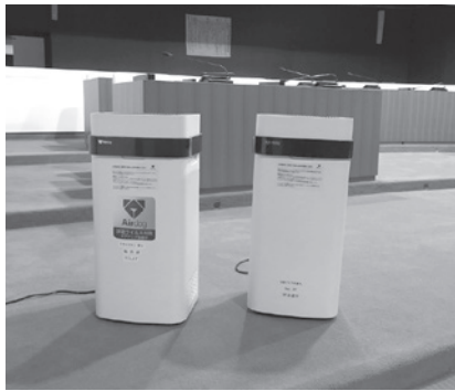
▲空気清浄機 ▼検温器

村長 臨時交付金の事業ですが、令和2年度から4年度まで、3年間の合計で約5億3880万円の事業を